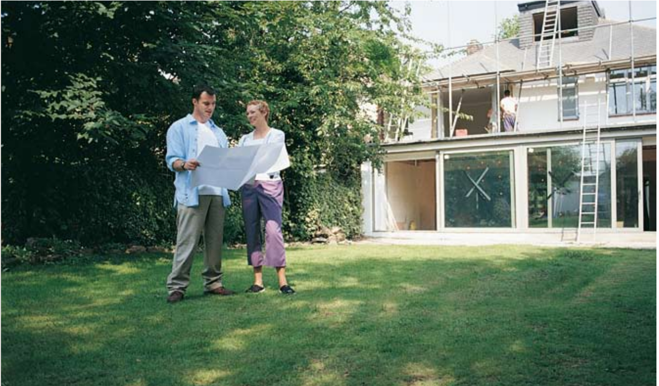
Häuslebauer profitieren: Bis zu 3.600 Euro bekommen sie aus dem Marktanreizprogramm

W eil Pelletheizer die Umwelt entlasten, schießt der Staat beim Kauf einer Heizanlage einen hohen Geldbetrag zu. Automatisch beschickte Pelletkessel, -öfen und Kombikessel Pellets-Scheitholz mit einer Nennwärmeleistung zwischen acht und 100 Kilowatt werden mit 36 Euro je Kilowatt installierter Nennwärmeleistung, also mit bis zu 3.600 Euro gefördert. Diesen Zuschuss gewährt das Bundesamt für Wirtschaft und Ausfuhrkontrolle (BAFA) im Rahmen seines Marktanreizprogramms. Die Mindestförderung beträgt 1.500 Euro.