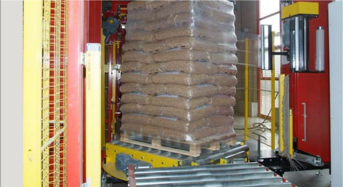
Liefervarianten: Holzpellets gibt es entweder lose oder in Säcken

D a die Zahl der installierten Pelletheizungen in den letzten Jahren stark gestiegen ist, hat sich auch das Händlernetz vergrößert: Deutschlandweit gibt es derzeit rund 400 Lieferanten. In einer umfassenden Datenbank bietet die Fachagentur für nachwachsende Rohstoffe (FNR) eine Übersicht der meisten Pellethändler und -produzenten. Auf www.bio-energie.de finden sich über eine Suchmaske Lieferanten in jeder Region. Vor allem große Brennstoffhändler wie beispielsweise die BayWa führen Holzpellets auf jeden Fall. Beim Kauf empfiehlt es sich, auf das Zertifikat „DINplus“ zu achten, denn nur hochwertige Pellets garantieren ein einwandfreies Abbrennen.