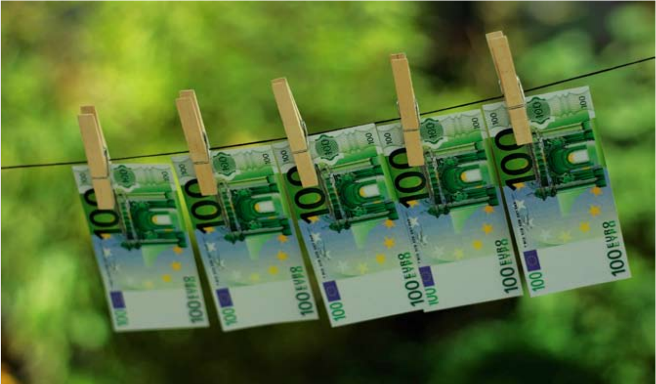
Fördervariante 2: Auch die Kreditanstalt für Wiederaufbau stellt Mittel bereit

A uch die Kreditanstalt für Wiederaufbau (KfW) belohnt umweltbewusste Heizer. Das CO 2 -Minderungsprogramm der KfW sieht zinsgünstige Darlehen bis zu 50.000 Euro pro Wohneinheit für die ökologische Sanierung von Gebäuden vor. CO 2 -sparende Investitionen wie der Einbau einer Holzpellet-Heizanlage können somit zu günstigen Konditionen finanziert werden. Alternativ besteht für Hausbesitzer zudem die Möglichkeit eines Zuschusses, den die KfW im Rahmen der CO 2 -Gebäude-sanierung gewährt.